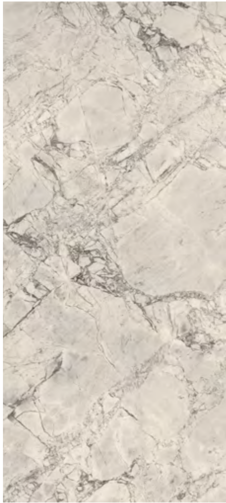
Panna da Trento | V3