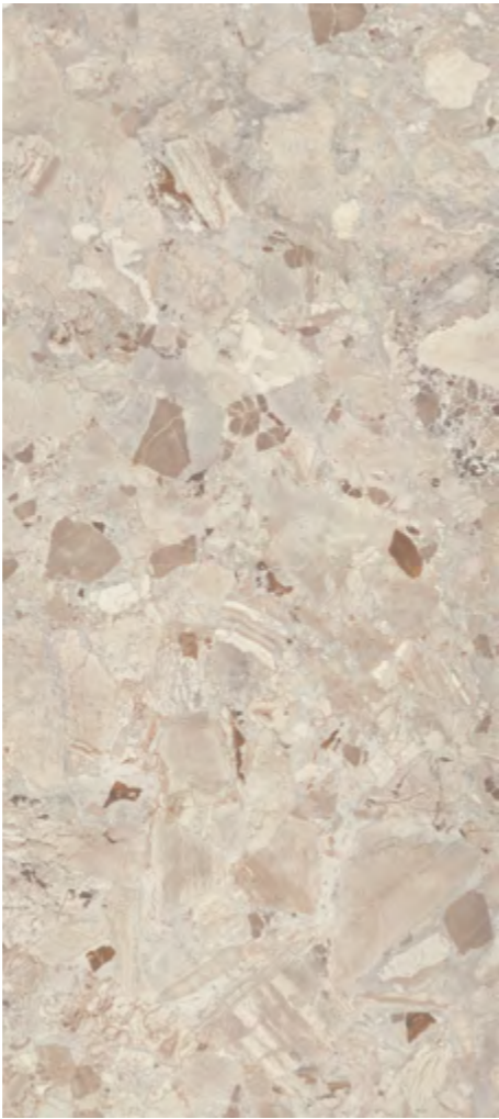
Mandorla da Milano | V3