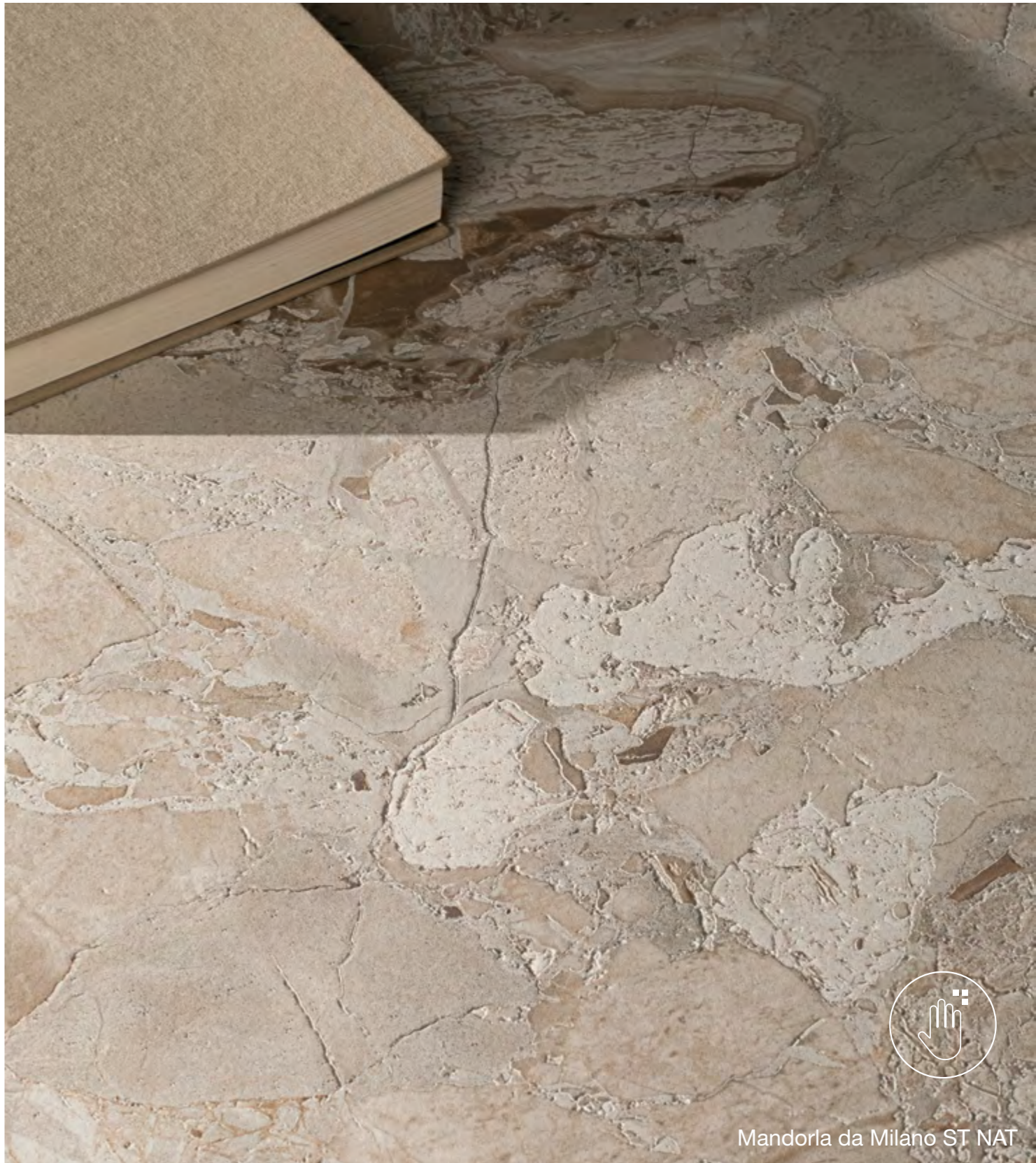
Mandorla da Milano ST NAT