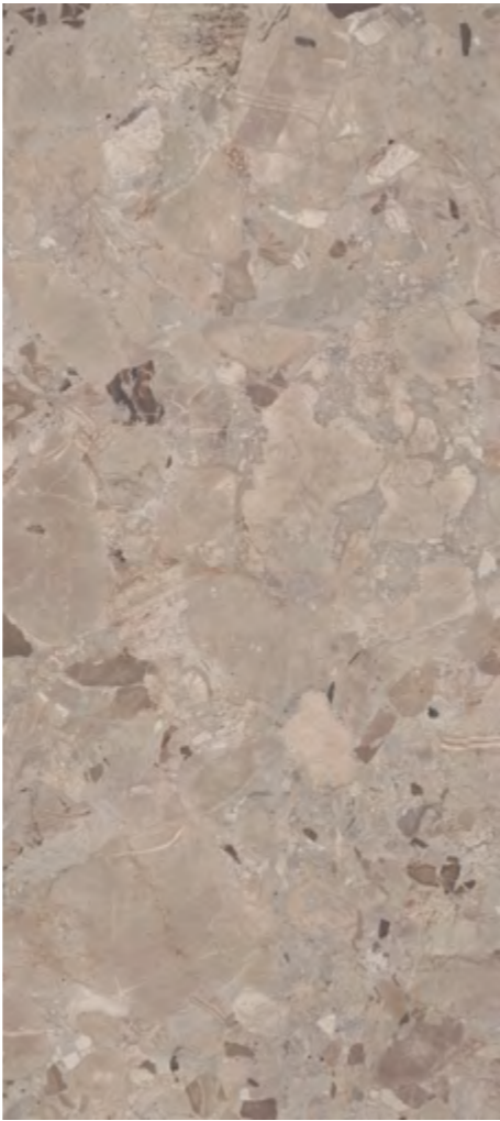
Mocaccino da Torino | V3