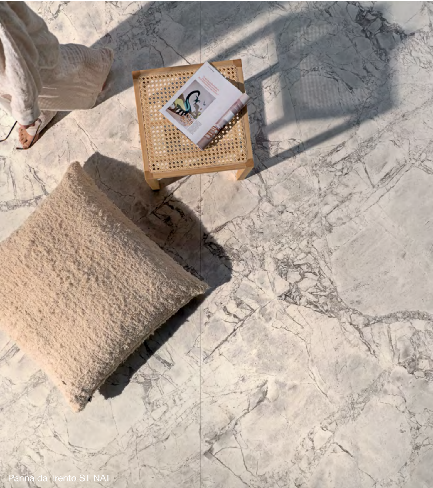
Panna da Trento ST NAT