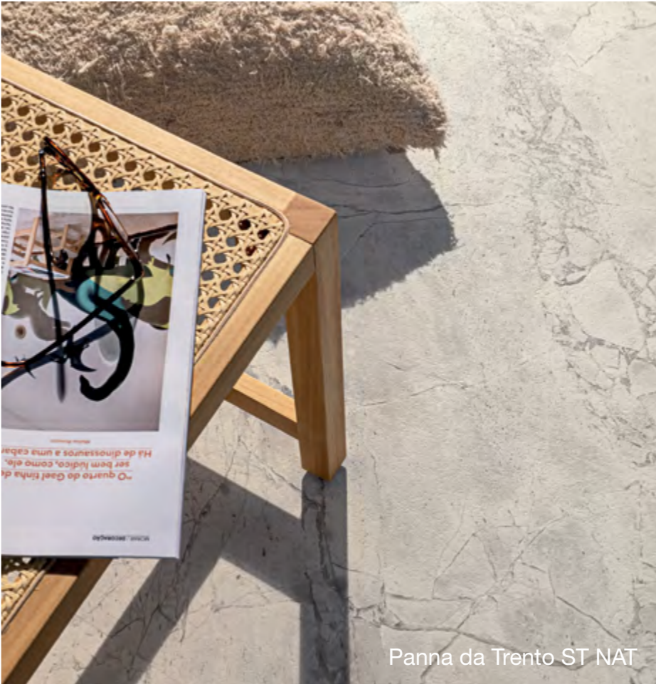
Panna da Trento ST NAT